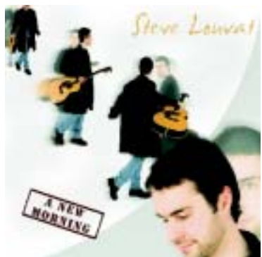
Avant d'être plus largement distribué, l'album est déjà disponible à Namur.

pour son instrument. Deux années de cours n'éteignent pas sa soif d'apprendre. « Le week-end, j'étais huit heures par jour sur mes cinq cordes, explique-t-il. J'enregistrais sur cassette les disques de banjoïstes légendaires comme Bill Keith ou Bela Fleck et je m'entraînais à reproduire les solos en les décodant à l'oreille. »